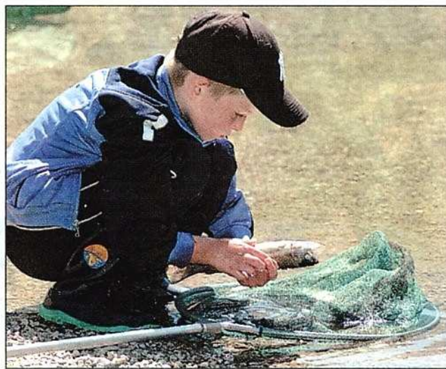
Auch Kinder sind vom Fischen begeistert: Ihnen bietet die Fischereivereinigung eigene Jugend-Fischercamps an.

Lebenseinstellung. Ein paar Stunden alleine mit der Natur, die Seele baumeln lassen, den Gedanken freien Lauf gewähren und bei einem plötzlichen Anbiss Spannung pur erfahren – das ist Fischen in seiner schönsten Ausprägung. Kärnten ist ein gewässerreiches Bundesland und damit ein Dorado für die Ausübung des Angelsports. Von kleinen, kristallklaren Gebirgsbächen mit wunderschönen Bachforellen über die herrlichen Seen mit Trinkwasserqualität bis zu renaturierten Staubecken entlang